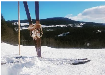
Treskitradisjoner handler også om å spille på lag med naturen.

Perspektivet handler om egenverdien av en kulturpraksis, ikke om praksis som begrunnelse for noe, slik bærekraft argumentet kan tolkes som. Ettersom formidling og overføring av «knowhow» står sentralt i konvensjonen, kan det være fristende å kalle perspektivet et «snowhow»-perspektiv