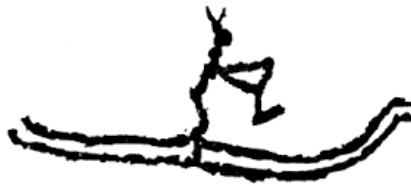
Helleristning på Rødøya, Alstadhaug: Et par ski eller båt?

Ski har fra de tidligste tider vært et effektivt arbeidsredskap og transport middel. Enkelte hulemaleri i Altai-/Xinjiangprovinsen i Nord-Kina kan tolkes som dokumentasjon på bruk av ski. I Norge er det først og fremst samene som kan takkes for å ha drevet fram skikulturen. Fra de tidligste tider har også de, slik andre folkeslag i subarktiske soner, vært avhengig av kunne ferdes i mange slags terreng.