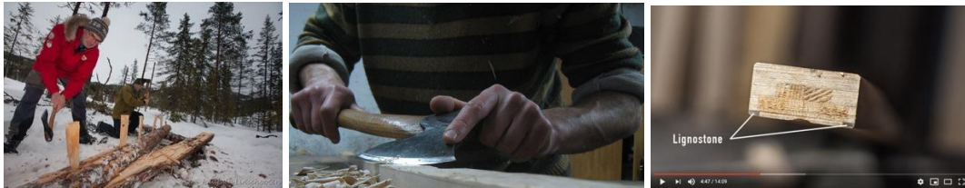
1,2:Fra tømmer til ski. 3:Snitt bilde av laminert ski limt sammen av opptil 6 ulike tre kvaliteter, produsert ved Rustad skifabrikk 2019. Fra dokumentasjonsfilmen Et siste par Rustad ski , Norsk håndverksinstitutt 2019

På den annen side vil en slik vinkling snevre inn aktørgruppen, det vil si CGI. Flere avanserte skimakere og brukere kan falle utenfor. En står i fare for å underminere tyngden i verneprosjektet ved å snevre inn gruppen av mulige og potensielt viktige støttespillere.