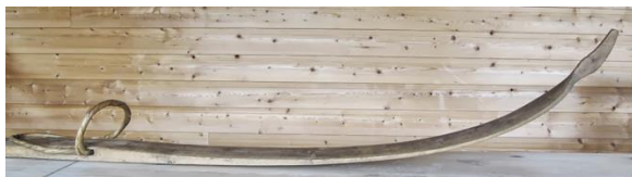
Lærer og hobbyhistoriker Arne Høyland har lagt ned stort arbeid i å dokumentere skimakertradisjoner på Vestlandet, her et eksempel på den spesielle framtuppen på et par vestlandsski.

Se nærmere drøfting under kapitlet USL- eller RL-nominasjon